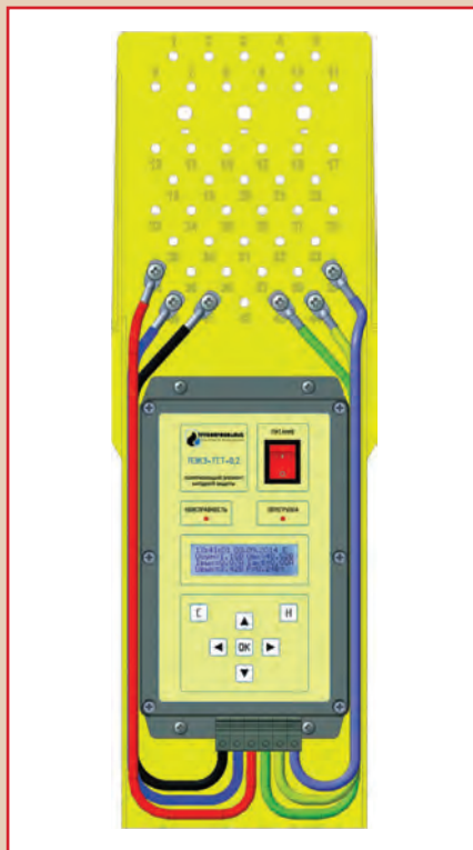
Рис. 4. Клеммная панель ПКМ-ТСТ-ПЭКЗ

• удаленный мониторинг и управление режимами работы с помощью специализированного программного обеспечения (две версии – локальный сервер и web-клиент).