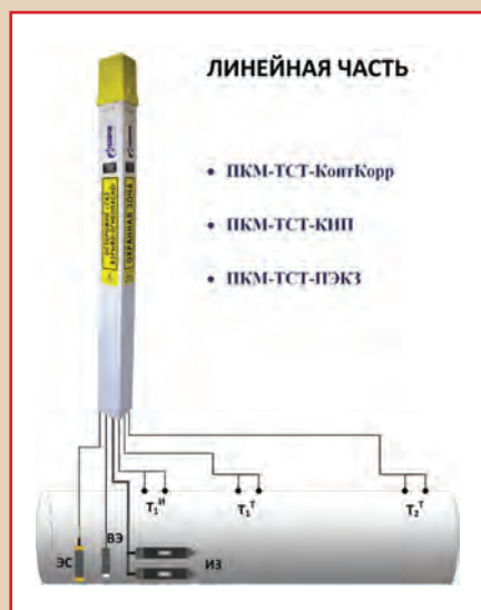
Рис. 1. Системы коррозионного мониторинга для линейной части трубопроводов

На линейной части трубопроводов применяются системы ПКМ-ТСТ-КонтКорр, ПКМ-ТСТ-КИП, которые позволяют контролировать скорость коррозии и полный спектр параметров коррозионной среды. Также для локальной катодной защиты применяется новая разработка компании – ПКМ-ТСТ-ПЭКЗ (рис. 1).