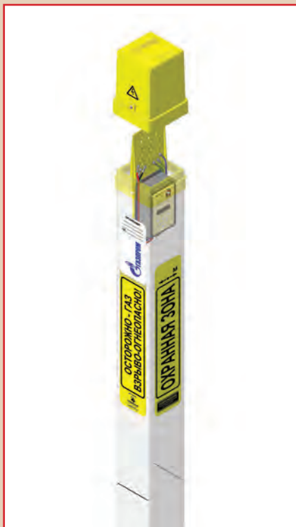
Рис. 3. Размещение ПКМ-ТСТ-ПЭКЗ в стойке

– переменное напряжение «сооружение – электрод сравнения»; – постоянный и переменные токи «сооружение – вспомогательный электрод»;